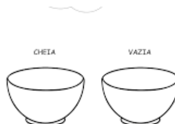
IMAGEM DA ATIVIDADE.

Vamos dar continuidade as nossas atividades da semana. Vamos falar sobre uma comida típica das nossas festas juninas a PIPOCA que não pode faltar durante as comemorações de junho. Para hoje peça para a mamãe fazer uma pipoca bem gostosa para você saborear, depois realize a atividade fazendo bolinhas de crepom brancas para colar dentro da vasilha que está escrito cheia representando a pipoca dentro da tigela. Boa atividade.